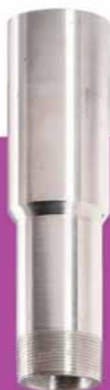
Adaptador salida bomba