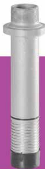
Adaptador salida columna